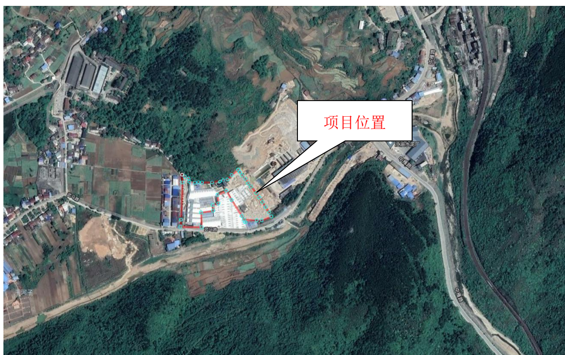
图 1-1 项目场地交通位置示意图

50万吨/年石英砂深加工及固废处理生产线项目位于江油市马角镇龙官村五组。项目场地交通位置示意图如下。